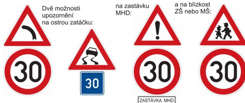
návrh svislého dopravního značení

Žluté tečky – přehledné místo vhodné pro omezovač rychlosti. Na některá z těchto míst by se měl nainstalovat informační radar nebo návěstidlo řízené radarem .