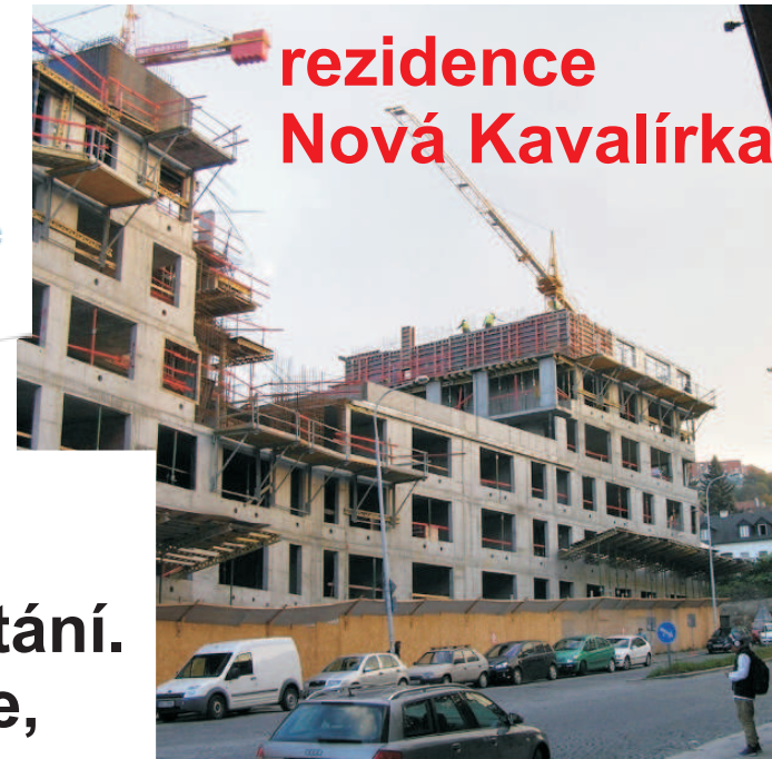
rezidence Nová Kavalírka

vizualizace stavby s parkováním na ulici nepočítá, v domě je ho nedostatek. Na parkování prostě