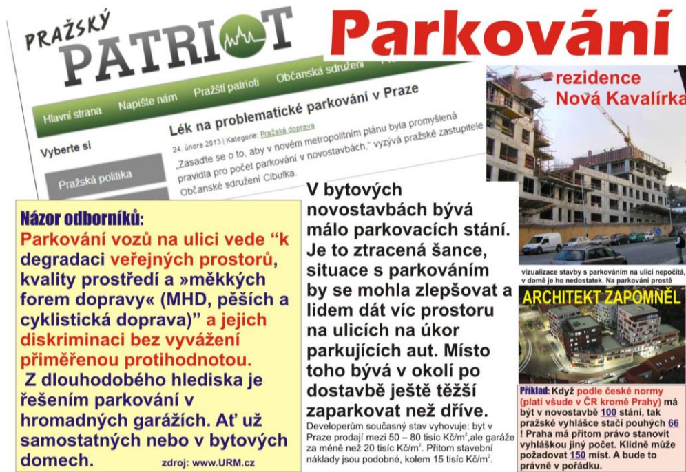
Obrázek 1: Plakát spolku Cibulka o parkování