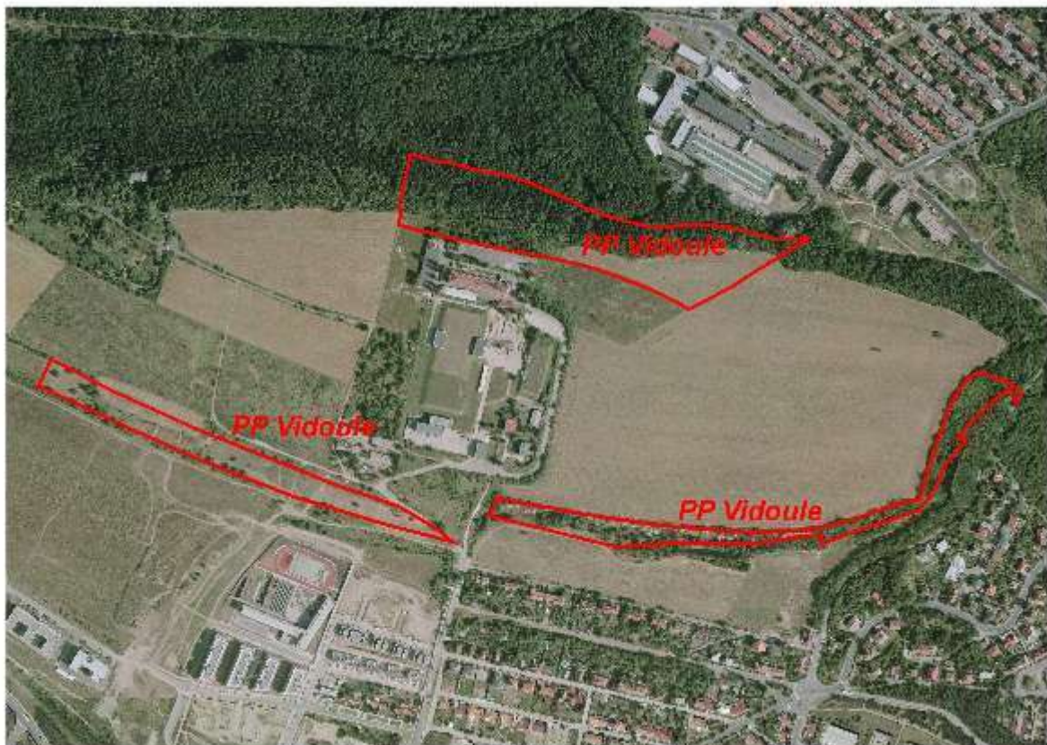
Příloha 1: Ortomapa a mapový nákres PP Vidoule (Vyhlášené vyhláškou NV hl. m. Prahy 5/1988 Sb.)